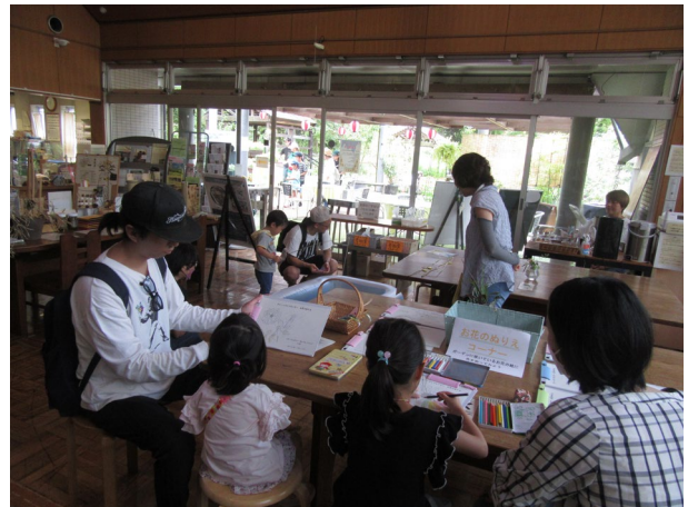
「ガーデンで咲いている」花の塗り絵は、グリーンライブセンターにしかないでしょう。素敵な試みです。(ローズクラブの皆さん)

ローズクラブの皆さんには、恵泉花とみどりの講座、ボタニカルアートの受講生がいらっしゃるのので、ガーデンで咲いているお花のぬり絵の下絵を描いていただきました。また、当日も遊び方を教えたり、参加賞を手渡して下さったりと大活躍でした。