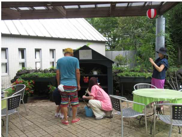
竹の水鉄砲でお面に当てられたでしょうか？涼しいひと時。 (多摩グリーンボランティア森木会 クラフトプロジェクトの皆さん)

ガーデンサポーターの皆さんには、笹の竿で魚釣りをするための画用紙の魚や、参加賞の折り紙のコマなどを作っていました。