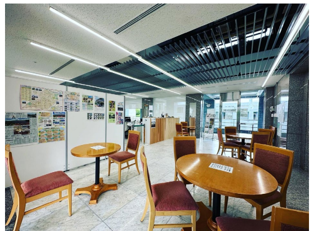
クリエイティブキャンパス企画室（パルテノン多摩5階東側） 2023年1月よりグリーンライブセンターの事務所がこちらに移転します。多摩中央公園と我々の化学反応がこの場で生まれることを期待しています。

この2つの役割を繋ぐ目的で開設したのが、私が現在勤めている「クリエイティブキャンパス企画室」です。クリエイティブキャンパス企画室では、市民活動の情報収集発信拠点としての機能と、「こんな活動がしてみたい」という相談を受け付ける窓口としての機能があります。クリエイティブキャンパス企画室で受け付ける相談は活動の種だと思っています。この種を花咲かせるために、周辺施設と一体となってプレイスメイキングをしていくことが我々の使命だと考えています。まだまだ手探りの部分も正直ありますが、精一杯努めてまいりますので、よろしくお願いいたします。