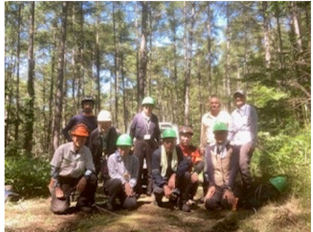
フレンドツリーサポーターズの皆さん(八ヶ岳)

連携して保全活動を継続して進め、市民の方々に親んでもらうことが FTS の主たる目的です。利活用を図ると共に、FTS 団体自身の森林管理の学習や伐木技術の向上も図りたいと考えています。また、この森は市内全小学校の『体験林業教室』の場としても大切な場所です。安全に体験活動が出来るよう林床整備を行い、サポートなどもできたら子どもたちとの交流も広げられると考えています。加えて、市民向けに八ヶ岳の自然の魅力発信も出来たらよいな・・・とも考えています。