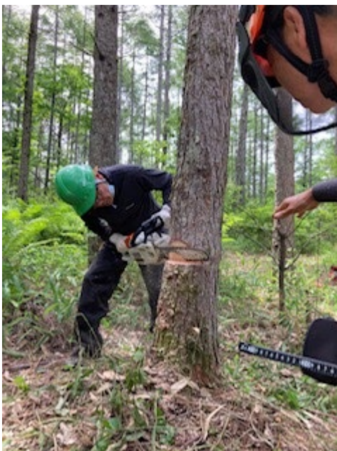
伐木作業。 受け口により伐倒の場所が決まるため、慎重に受け口を作る。 何人かでチェーンソーの向きを確認しながら行う。

八ヶ岳の市民の森は国有林で、自然豊かな森です。カラマツが多く、林床には季節の変化と共にたくさんの山野草が咲きます。春にはマイヅルソウ・イカリソウ、夏にはオカトラノオ、秋にはトリカブトなど・・・樹々の芽吹き、新緑、紅葉(カラマツは黄金色)と鳥のさえずり・・・深呼吸をすると生き返るようです。この森を森林管理署や自然の家と協議・