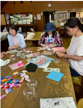
みんなで準備作業 (ガーデンサポーターの皆さん、 恵泉女学園大学学生)

8/19、20 の 2 日間、 グリーンライブセン ターでは初めての夏 祭りを開催しました。 酷暑という言葉がび ったりと当てはまる ような、暑い日々が 続いた今年の夏。子 どもたちが涼しい中 で、楽しく遊べるス ペースをご提供した いとのお考えから、急 遽開催を決めて準備